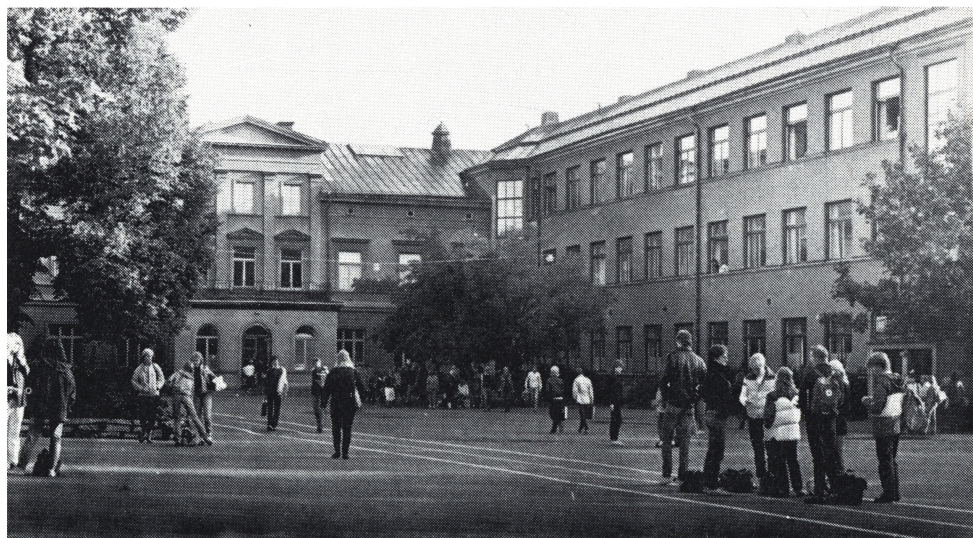
Några av de spridda byggnaderna.