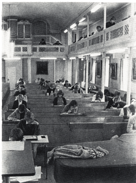
Skrivning i aulan - på de bänkar som skall bytas ut. Fotografierna är utförda av elever i klass N3B.