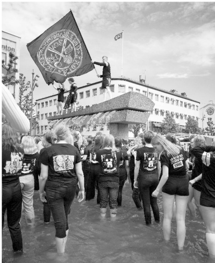
Krampensegern firas med fotbad på Stortorget.

Den 3 juni avgick Karro med den ultimata segern i Krampen och eleverna kunde efter avslutad tävling bada i likkistan. Tävlingen var ursprungligen mellan ”piltar och grisar”, det vill säga elever från Karro och Risbergiska. När Risbergiska gymnasiet lades ner blev Rudbeck Karros motståndare. Intresset och engagemanget blev då inte detsamma och efter överläggningar fattades beslutet om att avveckla Krampen. Förhoppningsvis ska den övergå i någon annan form och involvera flera skolor och skapa en större känsla av samhörighet.