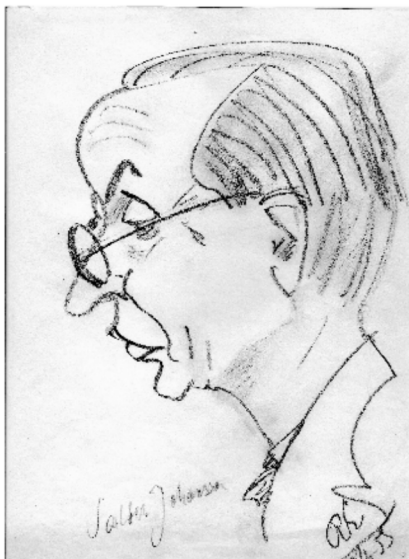
Klang-Johan ritad av Ragnar Ekström.