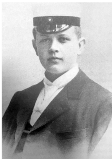
Hjalmar Bergman som student år 1900.