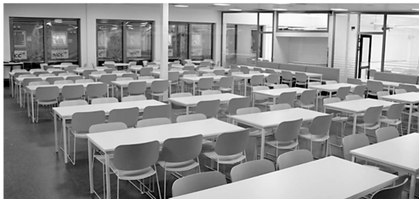
Bild som visar del av den nya skolrestaurangen som går i ton gult och vitt.

Äntligen kunde skolstarten ske på Karro och det var fantastiskt att åter flytta tillbaka till de vackra, varsamt renoverade lokalerna! NCC och Futurum har verkligen gjort ett fantastiskt fint jobb och ett särskilt tack vill jag rikta till projektledaren på Futurum, Bengt Asplund, som med stort engagemang och kunskap varit "mastermind" bakom hela projektet. Tyvärr blev dock inte Stallet inflyttningsklart förrän till sportlovet 2016 och inte heller var de två nybyggnationerna färdiga. Skolrestaurangen blev färdigställd under senhösten 2015 och Olympos – estetbyggnaden – till vårterminsstarten 2016. Jag vill verkligen rikta ett stort tack till alla medarbetare och alla elever för det tålamod och den professionalism som alla visade under den ansträngande tiden av byggnationer.