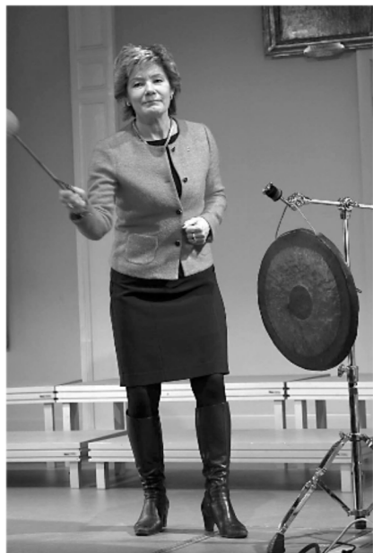
Invigingsgonggong av landshövding Maria Larsson.