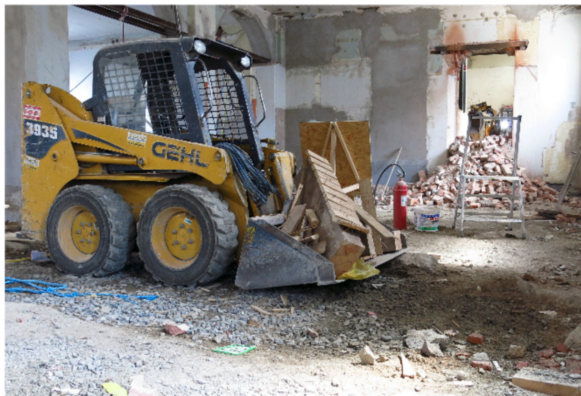
Karribien, blivande köket