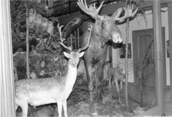
Örebro stadsarkiv, okänd fotograf 1980-tal

Då vi i förra årgången av Örebro-Karolinaren (ÖK) berättade om hanteringen av biologiska museet var frågan fortfarande öppen i väntan på den utredning som skulle pröva möjligheten att bevara museet i de ursprungliga lokalerna. Vi var beredda på ett negativt resultat och agerade med skrivelser från bägge våra föreningar, intervjuer, namnsamling och till sist slutade NA ta in stödande insändare, eftersom de saknade nyhetsvärde. Vi tryckte också extraexemplar av ÖK för att distribuera till kommunledningen och senare till fullmäktigeledamöterna inför det beslut vi väntade att de skulle ta i december.