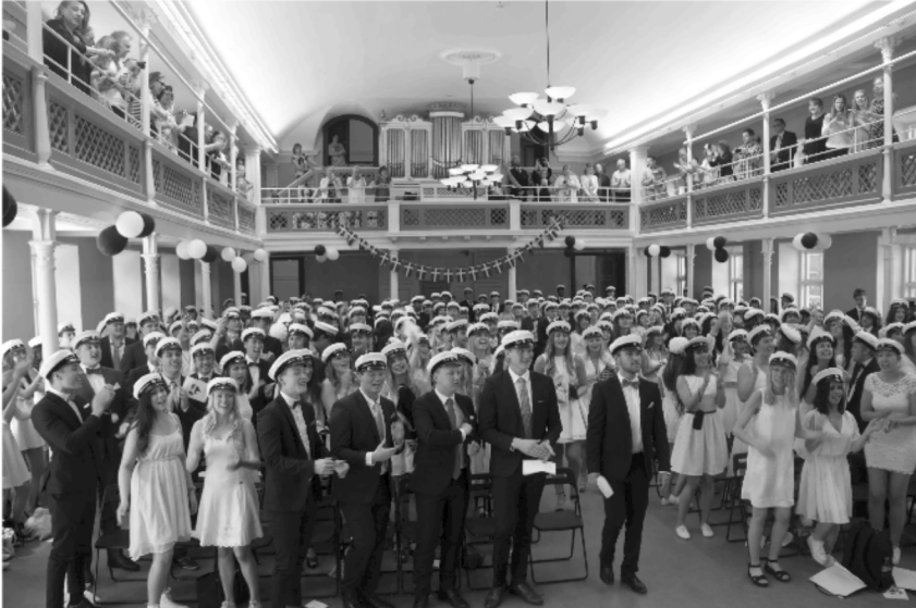
Den första studentavslutningen i Karros nyrestaureerade aula (men helt utan inredning, bara inhyrda stolar) den 12 juni 2015.

Vi minns nog alla hur det var att för första gången sitta på exakt den här platsen och vänta på att bli uppropade i vår nya klass. Det har gått så lång tid samtidigt som det var alldeles nyss. Idag tar vi studenten istället och jag är så otroligt stolt över att kalla oss för ett vi. Att vara en del av detta. Studenten hör ni, vi klarade det.