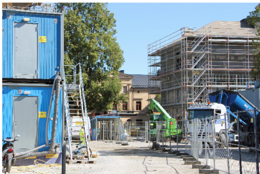
Nya huset Olympos.