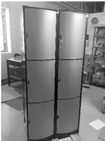
Elevskåpen, sprutlackerade med guldfärg.

En rolig anekdot vad gäller de nya elevskåpen är att de är sprutlackerade i guld. Varför guld kan man undra? Det hänger ihop