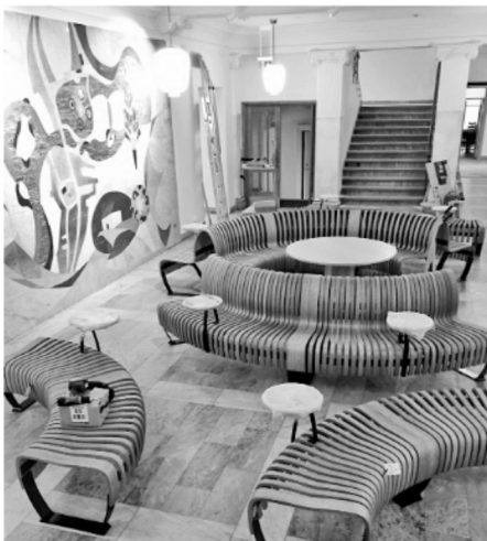
Fina nya sittgrupper i trapphallen, huvudbyggnaden, där café Karolina kommer att vara.