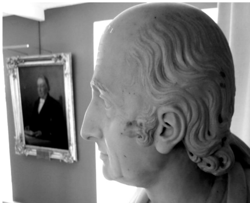
Karl XIII:s marmorbyst, som blivit kysst på kinden av någon nutida elev.

Aulan användes också som skrivsal. Kungarna och de bistert blängande rektorerna på fönsterväggarna gjorde inte stämningen muntrare, när man vändades över skriftliga prov.