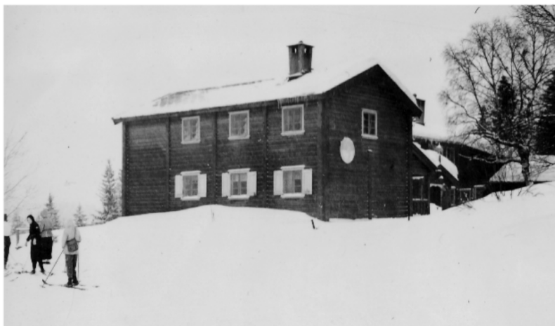
Huset med några av deltagarna syns på bilden.

Till inkvarteringen i Oslo Turnforenings klubbhus Kikkutstuen fortsatte vi med ”tricken” på Holmenkollenbanen, troligen till Frognerseteren, den station där marschen uppför började. Någon blev trött och fick lift med den hästanspända tross som medförde vår utrustning inklusive diverse livsmedel. I Kikkutstuen fanns det logement, kök och matsal/samlingslokal.