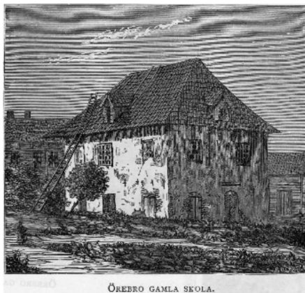
Gamla skolhuset. Teckningen, förmodligen träsnitt från 1860-talet, signerad O. Bebreng.

Kanske redan på medeltiden, men säkert från 1500-talet höll skolan till i det hus som ligger närmast Nikolaikyrkan och som nu är kyrkans gamla församlingshem.