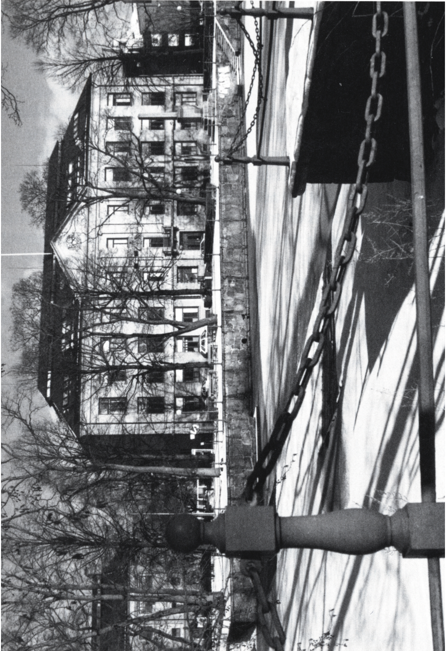
Karolinska skolan i vinterskrud