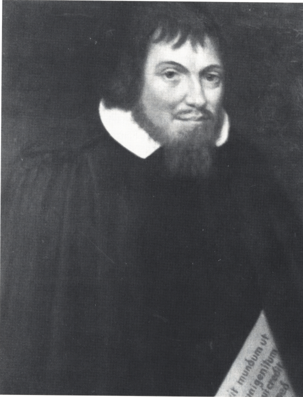
Rektor Jacobus Rudbeckius Målning efter teckning av Lars Wivallius