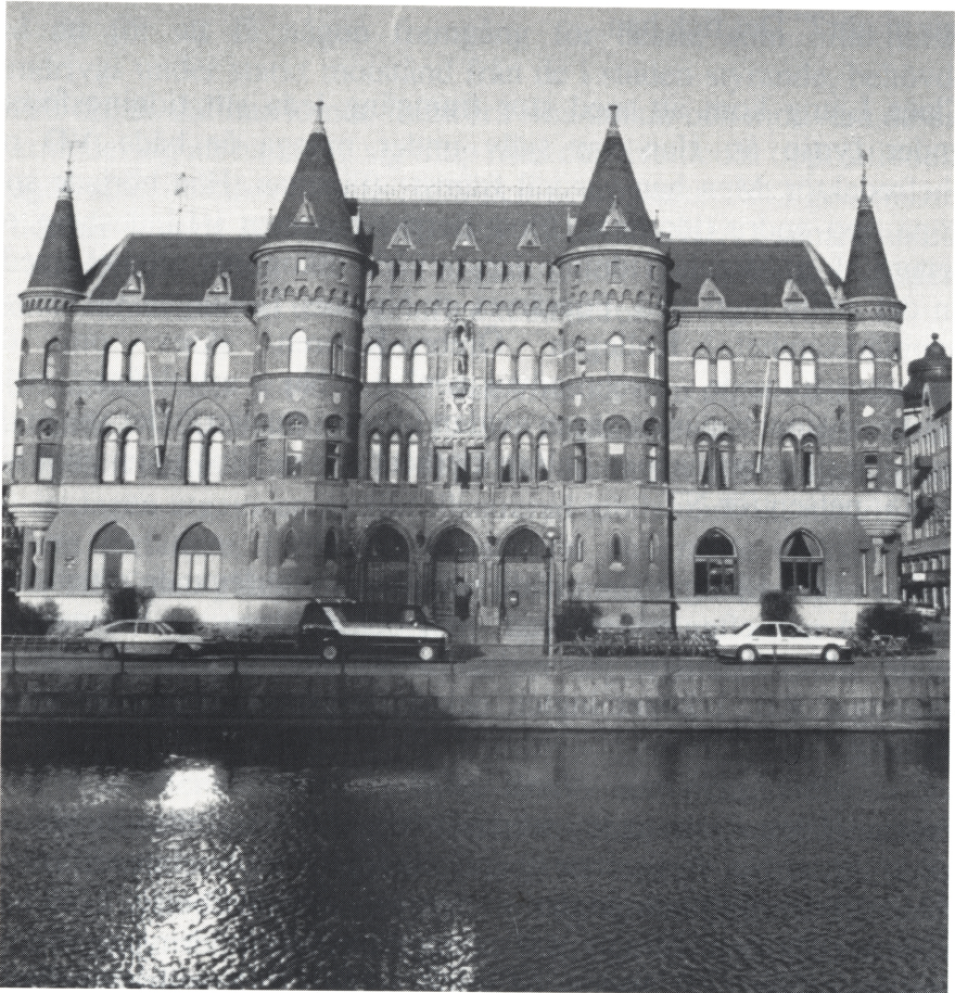
Sparbankshuset som nu är "Allehandaborgen"