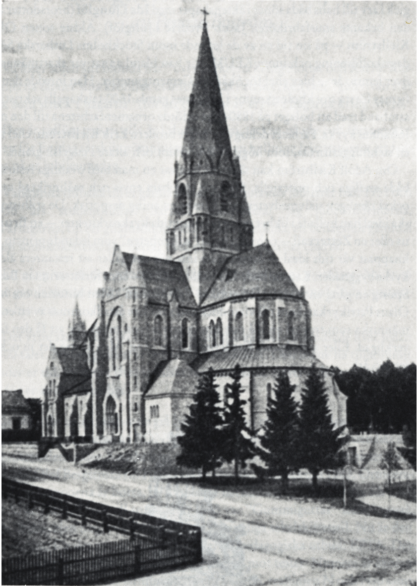
Olaus Petrikyrkan. Bilden tagen omkring 1915.