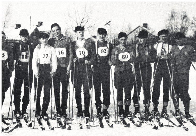
Skolpojkar rustade för skidlöpning 1931. Författaren med nr 92 på bröstet.

En karrograbb hade vunnit 1-milen — eller kanske ännu bättre — en teknist hade inte gjort det.