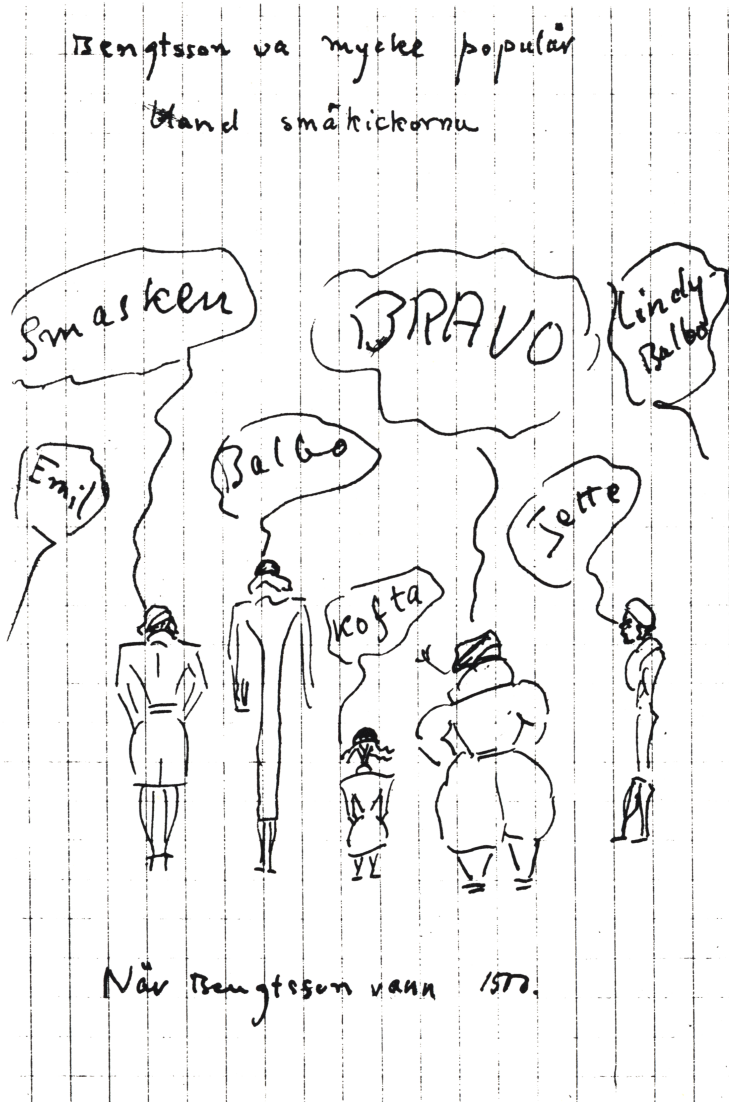
Teckning 1933 av Allan Borgström — utförd på ett anteckningsblock under en lektion i skolan.