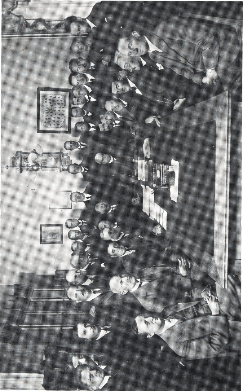
Karolinska läroverkets kollegium 1932