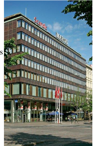
Hotell Scandic Marski Mannerheimvägen 10